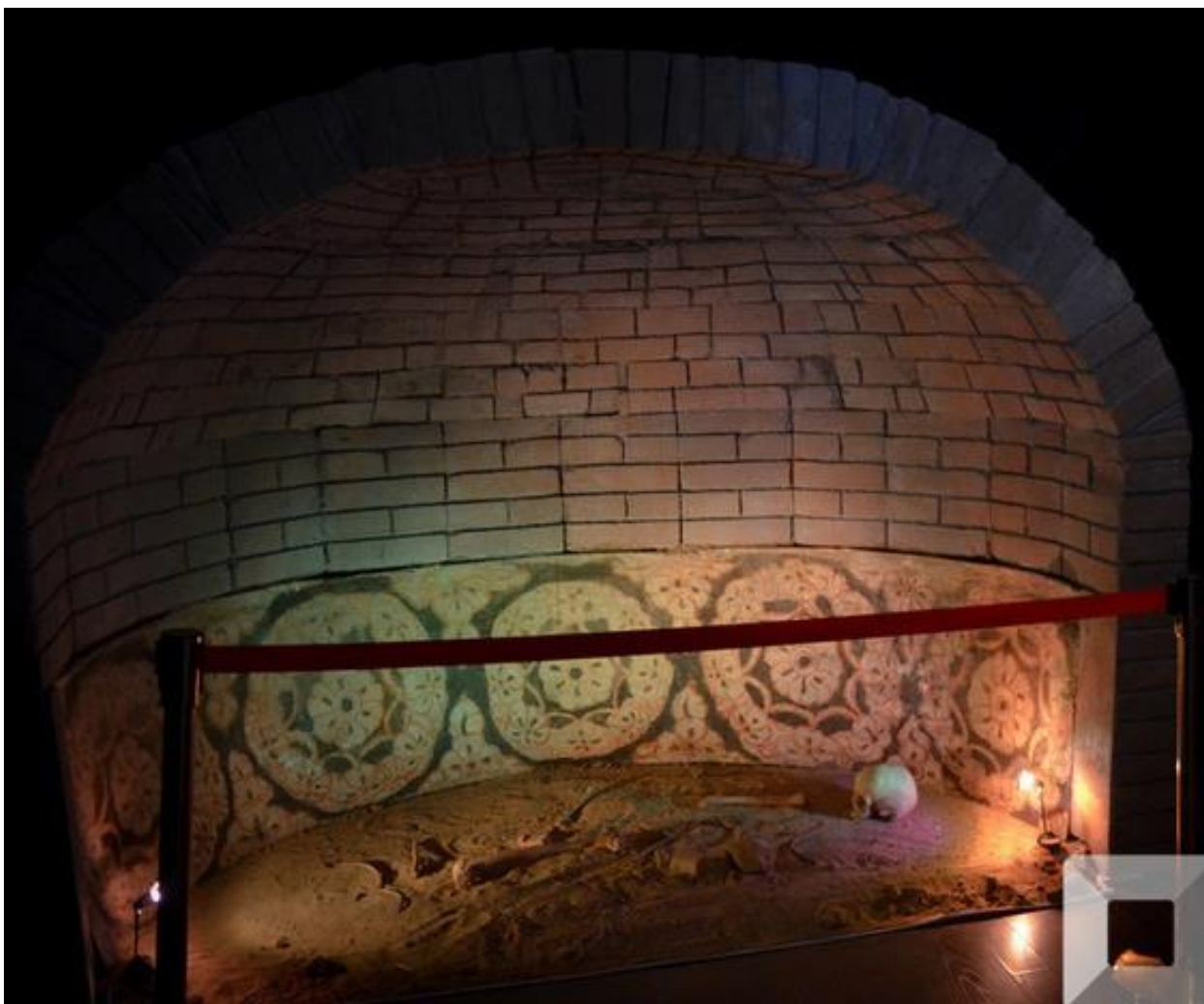
Зураг 1. Хундын хоолойн 5 дугаар дөрвөлжингийн бунхны ханан дахь бадам цэцэгэн хээ.