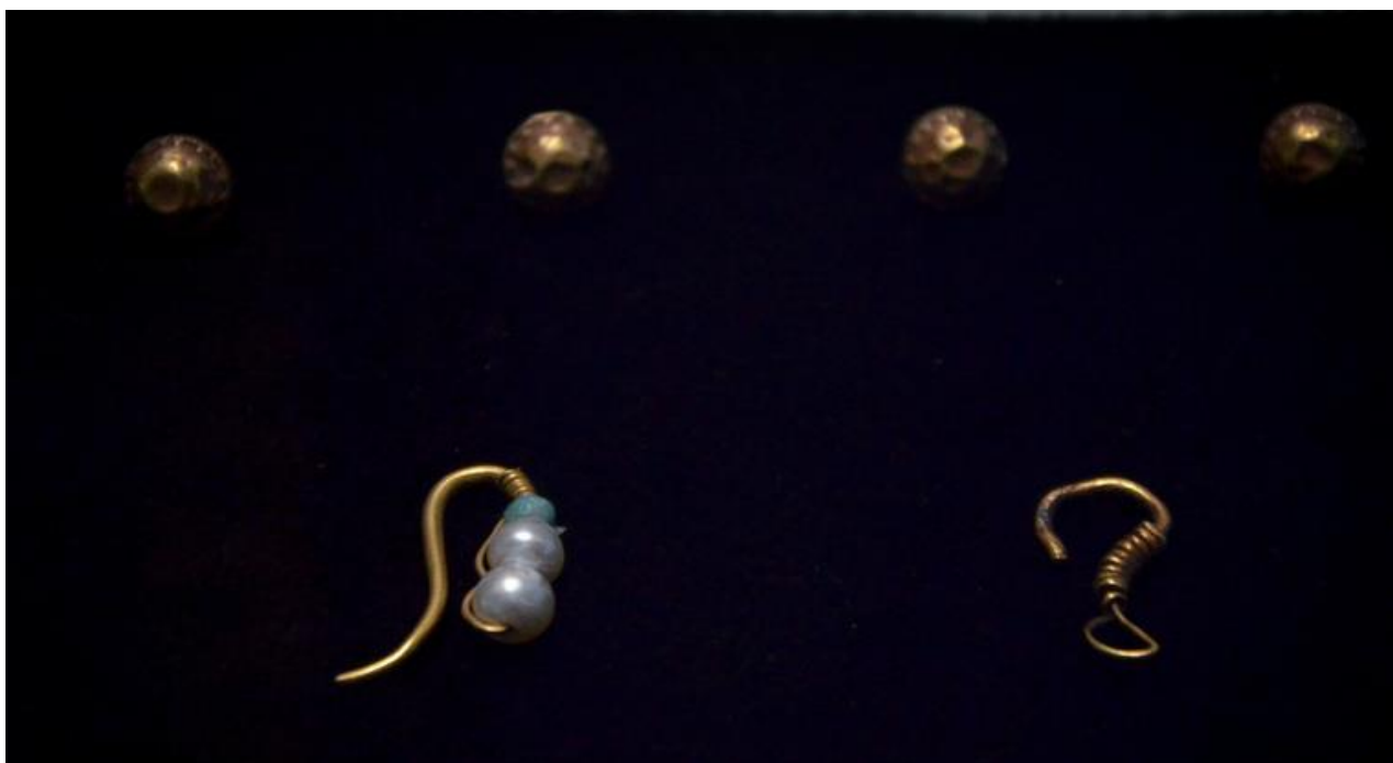
Зураг 3. Хундын 5 дугаар дөрвөлжингийн ойролцоох булшнаас илэрсэн хоёр төрлийн алтан ээмэг, алтан товч.