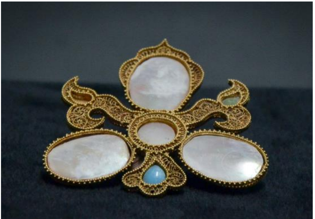
Зураг 5. Хулхийн амны нэгдүгээр дөрвөлжин болон наймдугаар монгол булшны малтлагаар илэрсэн маш нарийн хийцтэй алтаар урласан тана, оюу, номин чулуун шигтгээтэй богтаг малгайн цох .