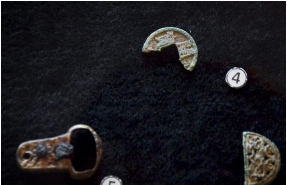
Зураг 4. Хундын 5 дугаар дөрвөлжингийн ойролцоох булшнаас илэрсэн зоосны хагархай болон хүрэл эд хэрэглэл.