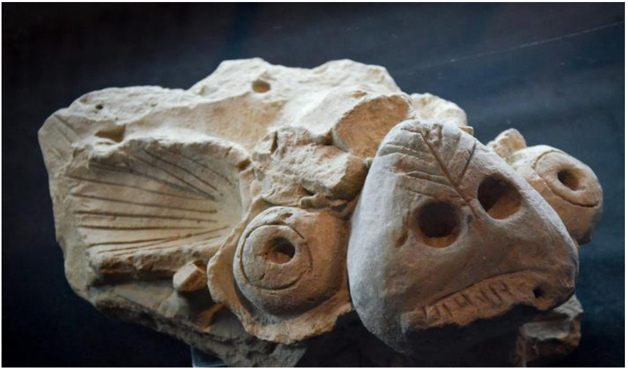
Зураг 7. Өвөрхавцалын амны 6 дугаар дөрвөлжингийн малтлагаас илэрсэн сүм дуган, барилгын багана, дээвэрт байрлуулдаг чимэглэл(хажуу талаас).