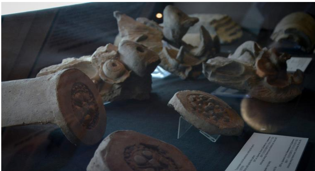
Зураг 6. Өвөрхавцалын амны 6 дугаар дөрвөлжингийн малтлагаас илэрсэн барилгын шавар чимэглэлүүд.

Уг олдвор нь Түрэгийн үеийн барилгын чимэглэл болоод Хятадын Тан улсын чимэглэлүүдээс өвөрмөц ялгаатай ажээ. Энэ чимэглэлийг сүм дуган, барилгын багана, дээврийн уулзвар хэсэгт байршуулдаг байсан бололтой.