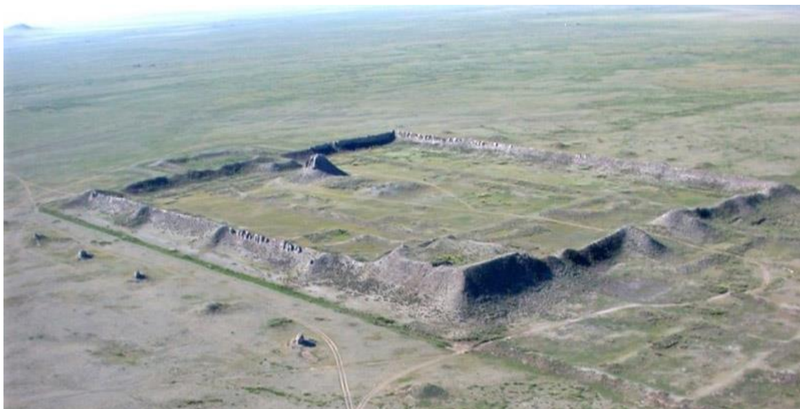
Уйгурын эзэнт гүрний нийслэл Ордубалык буюу Хар балгасын туурь