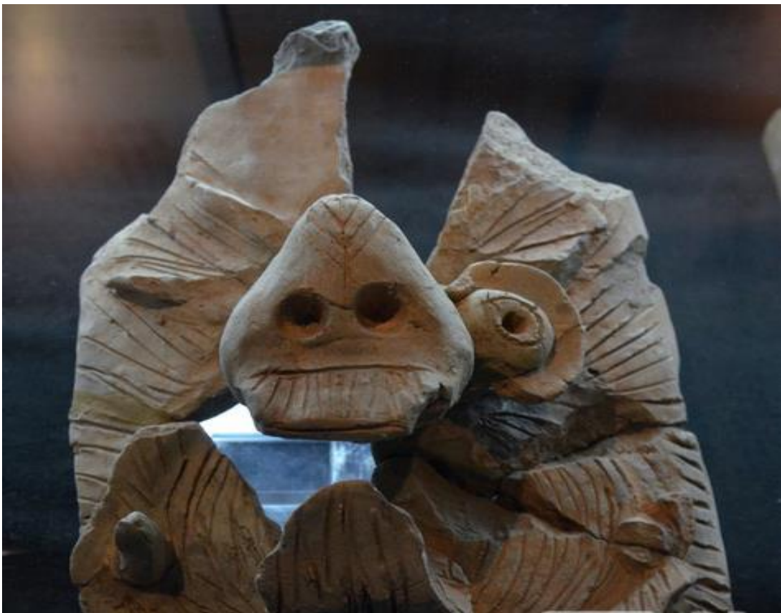
Зураг 8. Өвөрхавцалын амны 6 дугаар дөрвөлжингийн малтлагаас илэрсэн сүм дугана, барилгын багана, дээвэрт байрлуулдаг чимэглэл(эгц урд талаас).